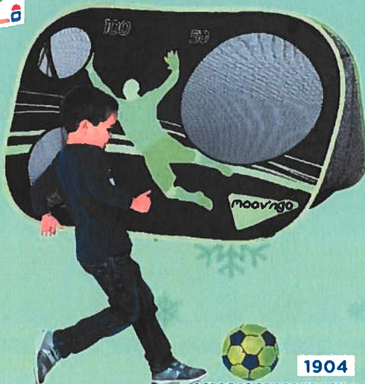
1904 CAGE DE FOOT POP UP 2 EN 1 2 faces pour d'entraîner et jouer. Sac de rangement et sardines de fixation inclus. Livré sans ballon. Dim : 90 x 130 x 85 cm.