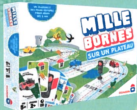
1068 MILLES BORNES PLATEAU Une édition pour toute la famille avec un plateau de jeu, des voitures et des attaques en 3D. Dès 5 ans.