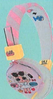
1429 CASQUE LOL GLAM CLUB Casque filaire spécifiquement conçu pour les enfants : la pression sonore est amoindrie et le volume max est de 100 dB. Diam. HP 4 cm. Long. câble 1,2 m. Prise jack 3,5 mm. Dès 8 ans.