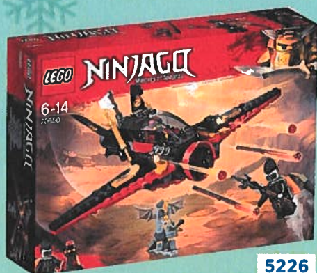
5226 POURSUITE DANS L'AIR Dès 4 ans.