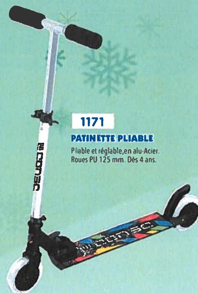
1171 PATINETTE PLIABLE Pliable et réglable, en alu-Acier. Roues PU 125 mm. Dès 4 ans.