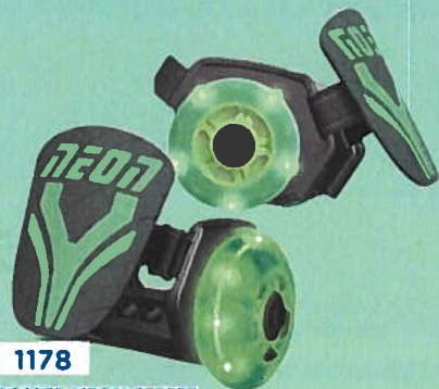
1178 ROLLER NEON STREET Plateau réglable en largeur et strap ajustable. Adaptable à toutes les pointures. 2 roues lumineuses à dynamo dont les LED s'allument au moindre mouvement. Roulements ABEC 5, pratique, léger et peu encombrant. Poids max : 60 kg.