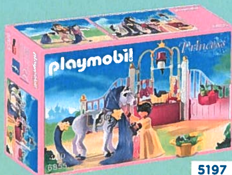
5197 ECURIE AVEC CHEVAL A COIFFER Dès 4 ans.